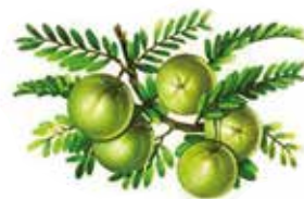
Phyllanthus Emblica L. (Amla)

L'associazione di Psyllium con Amla e destrosio è una formulazione tradizionale che consente a DAB 001 di agire più rapidamente rispetto ad altre preparazioni di solo Psyllium .