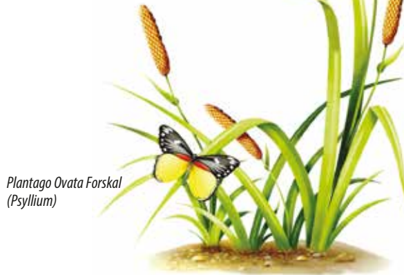
Plantago Ovata Forskal (Psyllium)